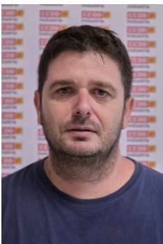
25. Josep Plensa