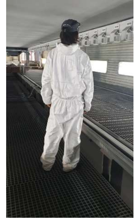
Después del foso intermedio