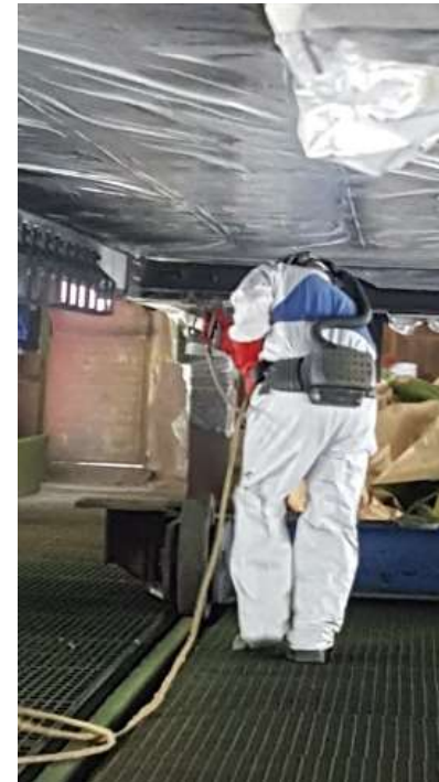
Antes del foso intermedio

Una de las principales deficiencias que existen en los puestos de trabajo de Alstom Santa Perpetua son la falta de evaluaciones ergonómicas correctas en todos los puestos de trabajo. Las posiciones forzadas están entre las principales causas de los problemas musculo-esqueléticos, por esta razón, el año pasado realizamos propuestas sindicales para mejorar los puestos de pintura. Los delegados de prevención de CCOO ante las negativas de la empresa denunciaron en Inspección de trabajo este tema y como consecuencia de esta denuncia, se ha realizado un foso intermedio que corrige las posturas forzadas.